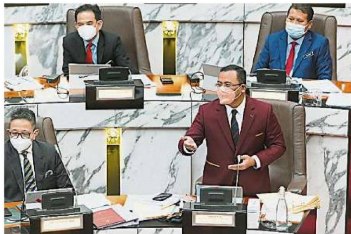
阿米鲁丁：雪州于今年7月以来有逾31万确诊病例，其中17%或5万3571人是工厂员工确诊。

“我们之前就曾探访过雀巢工厂，发现该厂仅在去年，耗费在防疫工作就动用6000万令吉，结果只有少数员工确诊，成功促使该厂未曾停过，可见只要做好防疫，其实就能避免员工确诊。”