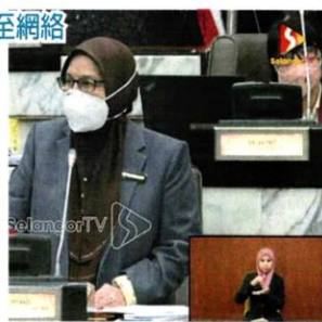
■西蒂玛丽亚：行动管制令期间，56个选区妇女自我增值中心活动已转至网络平台。

行动管制令期间，56个选区妇女自我增值中心（WFC）的活动已转至网络平台，继续给予妇女培训。 雪州行政议员西蒂玛丽亚指出，截至8月，中心举办了134项线上活动，其中109项是技能活动，25项是能力建设活动。 她说，技能活动以烹饪占最多，达63项，其次是手工，有31项。 “截至8月，州府拨款60万令吉予州内所有妇女自我增值中心，还有余款239万令吉待用。” 西蒂玛丽亚周四出席雪州议会，口头回答吉兰丹区议员黄洁冰的提问时，这么指出。 她说，疫情下，妇女自我增值中心的活动也要继续下去，以达到成立宗旨。 “这个专属女性的活动中心，能协助提升妇女的自我潜能、自信和就业机会。”