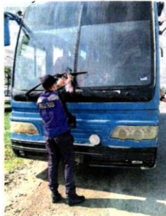
■一些重型交通工具也长期废置，严重影响通道和道路安全。

(巴生26日讯)巴生废车处处，破坏卫生、阻碍通道、破坏治安兼影响市容等，成为巴生市议会升格为市政厅的“绊脚石”之一！