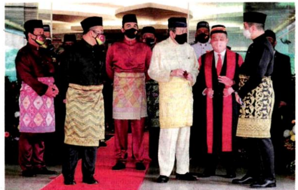
Pada 23 Ogos lalu, Sultan Selangor, Sultan Sharafuddin Idris Shah menzahirkan rasa dukacita kerana masih ada penjawat awam dan pemimpin politik tidak jujur melaksanakan amanah walaupun banyak kali peringatan diberikan.

suah untuk faedah organisasi. Setahun sebelum itu, negara menggubal Pelan Anti Rasuah Nasional (NACP) 2019-2023 bagi meningkatkan usaha memerangi rasuah secara menyeluruh.