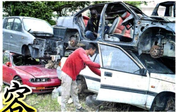
■巴生区废车太多，仓库人员每天忙得不可开交。