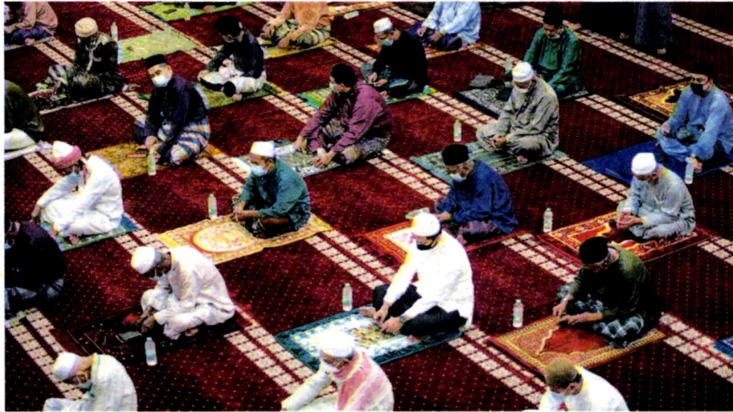
SELANGOR menetapkan ahli politik tidak akan diberi tauliah mengajar agama di masjid dan surau di negeri berkenaan. - GAMBAR HIASAN

Keputusan dibuat Selangor pada 6 April lalu