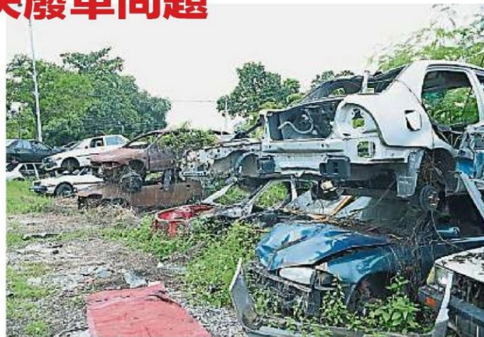
巴生市议会今年初至8月,共接获多达216宗有关废车的投诉,而仓库内还有197辆废车有待处理。

巴生市议会在今年初至8月为止,就接获多达216宗废车投诉,而仓库内还有197辆废车有待处理。