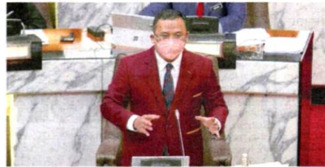
Amirudin ketika Persidangan Dewan Undangan Negeri (ADUN) Selangor pada Khamis.

sehingga tempoh ditetapkan tamat," katanya sewaktu Persidangan Dewan Undangan Negeri (DUN) Selangor di sini pada Khamis.