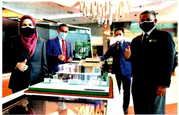
PKNS menyasarkan nilai jualan RM24 juta melalui program PKNS Plus Mesti Beli yang menampilkan pelbagai pilihan produk hartanah dengan harga menarik.

narawakan kediaman yang siap diduduki dengan pelbagai pilihan dan pakej menarik serta merupakan pelaburan jangka panjang yang menguntungkan.