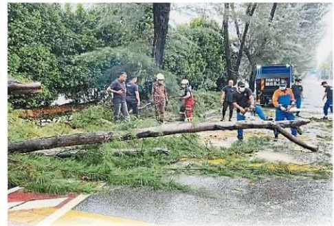
遇上狂风暴雨导致树倒后，一般会由快速行动队来处理，但若人手不足，也会召消防员前来协助。

由于千百家新村及SS40路是水灾黑区，最严重时水位高达5呎，万达镇州议员嘉玛莉亚在2019年与水利灌溉局官员反映水灾问题，联邦政府也拨款2000万令吉，计划在千百家新村河边修建防洪墙。目前这项计划已通过批准，并在防洪墙设计阶段，以确保有关防洪墙的设计可以持久耐用。嘉玛莉亚与水利灌溉局官员也在2个星期前到千百家新村河流一带进行巡视。”