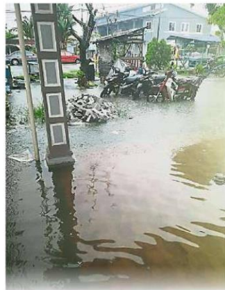
蒲种甘榜登加及甘榜瓜拉双溪峇鲁在20日下午发生闪电水灾，部分居民的住家被水淹入。