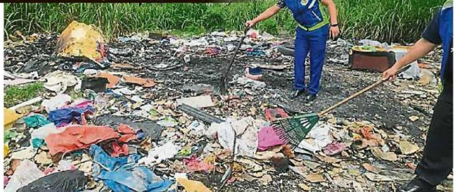
有些不负责任的民众,将垃圾丢在私人空地上,甚至还放火焚烧垃圾,令市议会百般无奈。