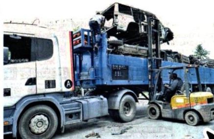
工作。要把废车从原地拖走，也是一项繁重的工作。