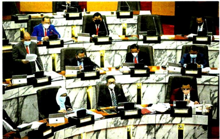
PERSIDANGAN Dun Selangor di Bangunan Dewan Negeri Selangor, Shah Alam, semalam.

Katanya, syarat itu ialah individu terbabit perlu menyampaikan ceramah tanpa menyentuh isu politik kepartian, mengaitkan