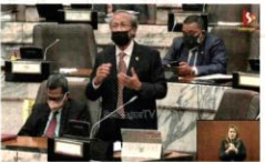
德德利斯州府政府關注災情問題。