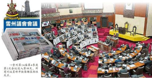
依兹汉：研究路線“友善發展”