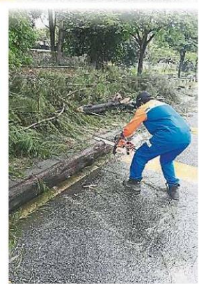
一旦接获树倒的通报，快速行动队会尽快处理，并把道路清理干净。

另外，在发展十分迅速下，部分沟渠没有妥当管理，当渠水的流动变得迅速时，大排水沟的渠水流得太快，导致小水沟的渠水无法顺利流出去，也会导致因