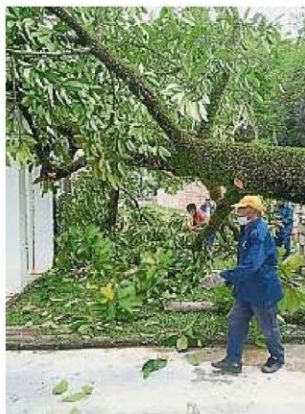
市议会若接获有关“高风险”树木的投诉,会尽快派员处理,避免发生不必要的意外。

虽然巴生市议会在今年6月和7月份所接获的投诉已减少,不过有关垃圾投诉和动物干扰的投诉,还是占大多数。